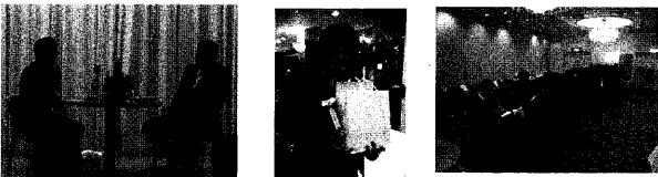
コラ子会 (中央は、2009年のベストなリストのSさん)