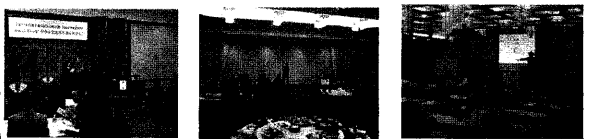
青年部県大会 (他の青年部の事例など見直しに役立ちます!)