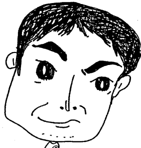
山田副部長 (山口県電気工事工業組合) by 役員一同