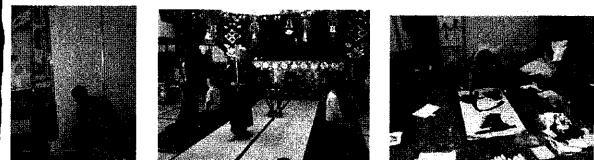
スーパーホテルすこ、笠原、書道などをやることも!!