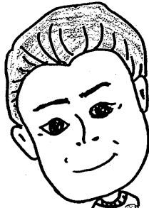
福井副部長 (山口県石材加工協同組合)