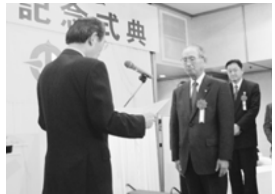
山口県中小企業団体中央会会長表彰

優良組合 (12組合) 柳井輸送コンビナート協同組合 平生町建設業協同組合 ツルガハマ商業協同組合 中央街商業協同組合 山口県自転車軽自動車商協同組合 周南地区鉄工協同組合 宇部新天町名店街協同組合 下関砂利販売協同組合 下関ふく全国出荷協同組合 下関南風泊水産団地協同組合 西長門コンクリート協同組合 長門建設業協同組合