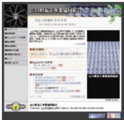
山口県瓦工事業協同組合HP http://y-kawara.jp/

山口県瓦工事業協同組合は、青年部が中心となって『組合員並びにお客様が探したい情報がすぐに探せるサイト』をコンセプトにホームページを作成しており、「組合概要」のほかに「屋根のまめ知識」や「なんじゃろ??の世界」などの消費者向けの面白い情報も満載です。