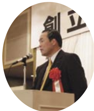
長谷川県議会副議長

のもとに、県並びに関係団体等との連携を図りつつ、中小企業の皆様のご期待にお応えできるよう、なお一層の努力をしていく。」旨の開会挨拶があった。