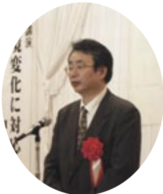
柏葉中国経済産業局産業部長

連携」、「創業」、「経営革新」の3つを掲げ、中小企業者の皆様の視点にたち、新連携支援については、連携による新しいビジネスパートナーの構築を、創業支援については、新た