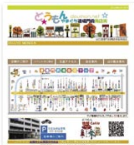
山口道場門前商店街振興組合HP http://www.doumon.net/

山口道場門前商店街振興組合は、個店情報やイベント情報など商店街でのお買い物や楽しい情報が満載の内容となっています。「店舗のご紹介」では、経営者の素敵な笑顔やお店のコンセプトが掲載され、今以上に道場門前のお店が好きになることでしょう。みなさん是非、一度アクセスしてみてください。