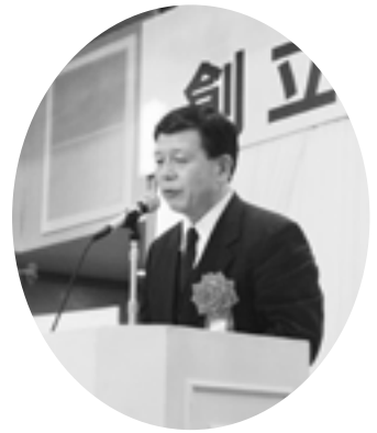
成宮全国中央会専務理事

続いて、中小企業組合の組織化、中小企業の発展・振興に寄与された優良組合や組合青年部をはじめ、組合の発展に功績のあった功労者及び優良役職員の表彰が行われた。