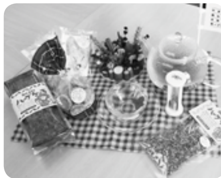
みんと村のハーブ商品

ています。ハーブを求めて来られたお客様に満足して頂けるようなみんと村を目指し、爽やかなハーブの香りと手作りの味をお届けします。ホームページ又はみんと村にぜひお越し下さい。」と述べた。