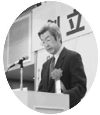
江崎商工中金理事長

二井知事からは「組合をめぐる環境は大きく変わってきており、これから新たな時代の流れをしつかりと踏まえながら、協同組合のあり方、そしてどのような運営をしていくのか、皆様方のご尽力を期待している。個々の企業の努力はもちろん、お互いが助け合うことが重要となってくる。県としても、新事業、新分野への進出等、皆様の取り組みを応援し