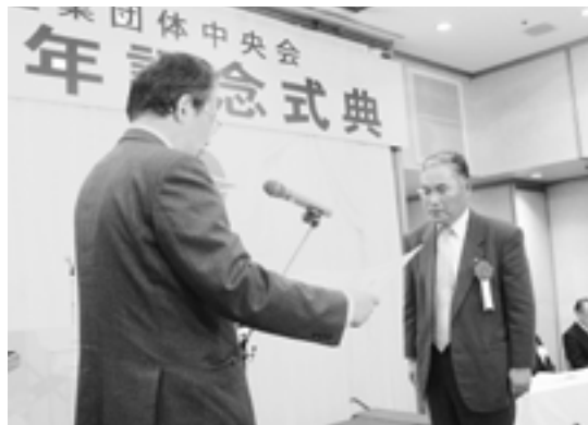
中国経済産業局長表彰