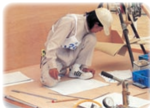
山口県管工事工業協同組合