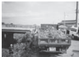
河川海岸愛護運動で清掃活動

今年で51周年を迎えました。組合員の総力を結集し、共存できる環境づくり等、組合としての多くの課題に取り組み、また、河川愛護運動参加、異常気象時の対応等、地域社会への貢献に努めながら地域住民との共存共栄も図りたいです。