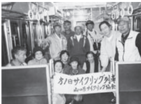
第1回サイクリング列車の参加者の皆さん

昭和37年より、自転車の防犯登録業務を警察および山口県二輪車安全普及協会と協力し行っている。自転車の防犯登録証により誰の持ち物か即座に判る仕組みが出来ており、盗難と犯罪の予防に役立っている。また近年、自転車は車道を通らず歩道を通る事が出来るようになり、車と自転車の事故は減ったが、自転車と人との重大事故が増えてきている。そこで組合では