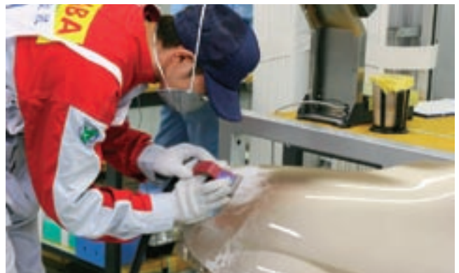
山口県自動車車体整備協同組合