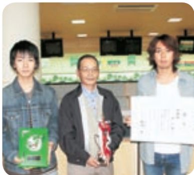
準優勝 株)村上組チーム