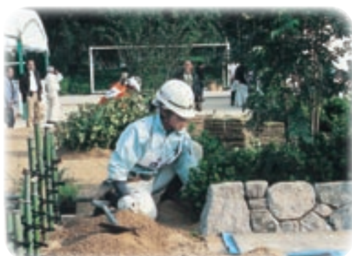
社団法人山口県造園建設業協会