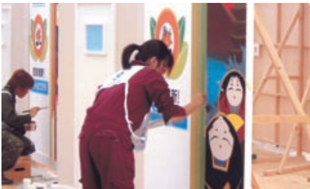
山口県屋外広告美術協同組合