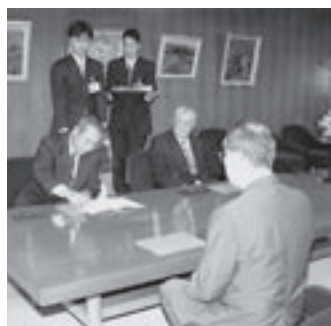
光市建設業協会、大和町建設業協同組合と調印

市内で災害が発生、または発生の恐れのある場合、市の災害防止活動と復旧活動に協会と組合が物資や機材の提供、人員の派遣などで協力する。