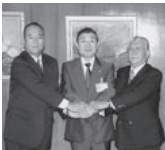
（左から）兼崎会長、末岡市長、平池理事長