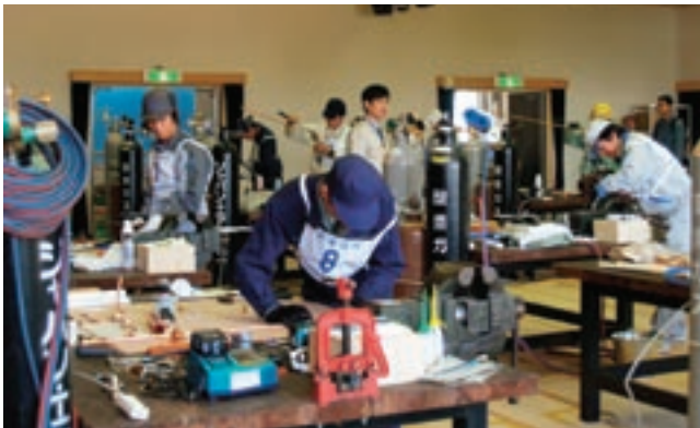
山口県冷凍空調設備工業会