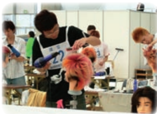
山口県理容生活衛生同業組合