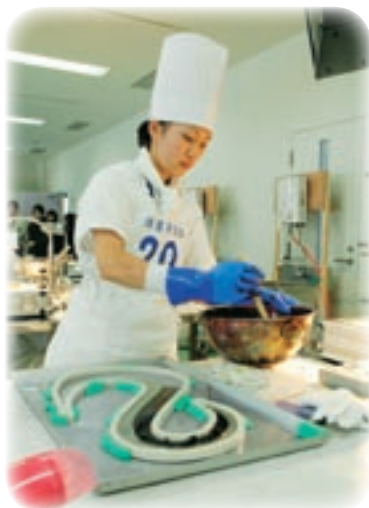
山口県菓子工業組合