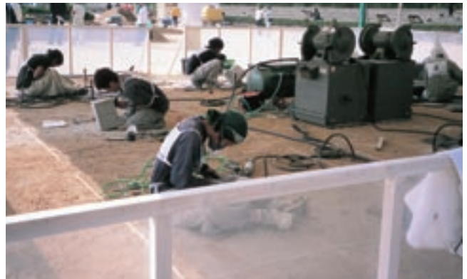
山口県石材加工協同組合