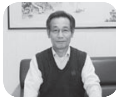
深田連絡員 (長門建設業協同組合 専務理事)