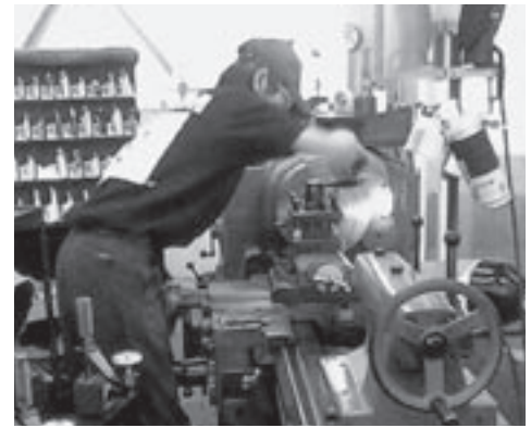
日立笠戸協同組合