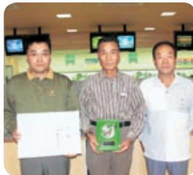
第3位 大林産業(株)Aチーム