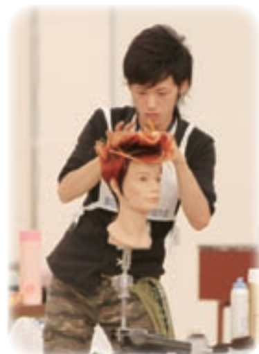
山口県美容業生活衛生同業組合