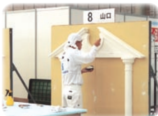
山口県左官業協同組合