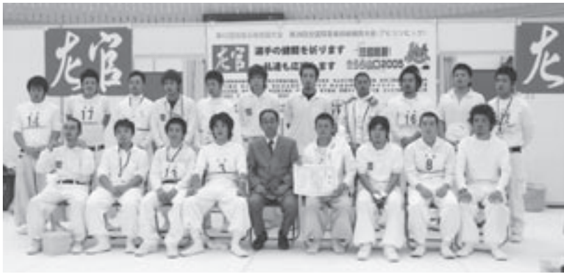
山口県左官業協同組合