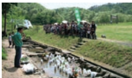
表紙写真 一船方農場 (阿東町)

5月3～5日、みどりの風協同組合が主催する「はらっぱまつり」が開催され、多くの家族連れで賑わいました。