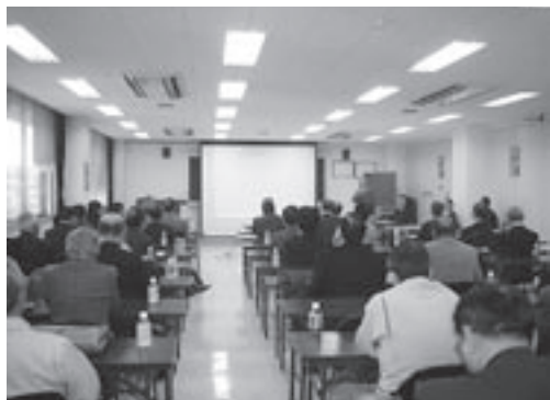
オーナー向け意識啓発セミナー