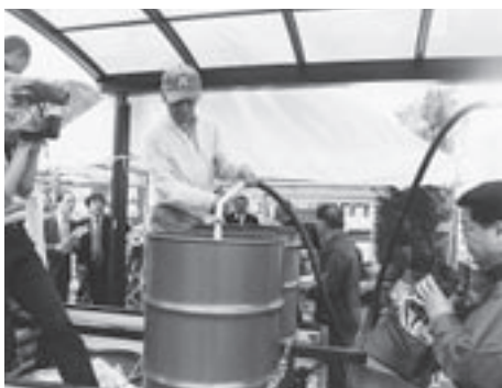
◀はぎ温泉 温泉スタンド

昨夏、越ヶ浜中学校の敷地内の掘削で湧出した「はぎ温泉」の湯をこのほど市内8箇所のホテル・旅館等へ配湯を始めた。湧出場所に温泉ポンプを設置し、国道を挟んだ一角に50トンタンク2基に湯を貯蔵している。温泉の成分は、カルシウム・ナトリウム・ホウ酸・ラドン等が含まれ、療養泉として医療的な効果も期待されている。